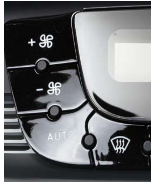
BASECOAT + TOPCOAT

DIEGEL hat in diesem Bereich sehr spezielle Lacksysteme entwickelt, die den besonderen Kundenanforderungen gerecht werden. Diese Systeme haben eine exzellente Beständigkeit und können darüber hinaus gelasert werden. Neben den zweischichtigen Aufbauten ist auch ein einschichtiges Lacksystem verfügbar.